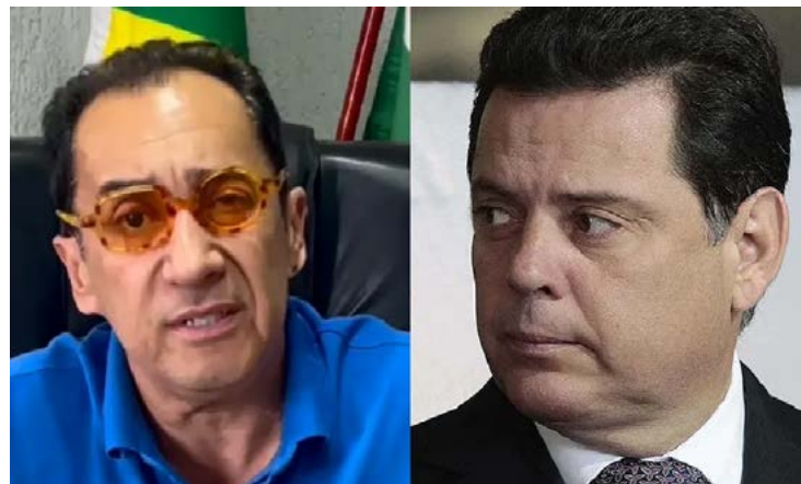
Jorge Kajuru (PSB) e Marconi Perillo (PSDB): reconciliação política após ataques