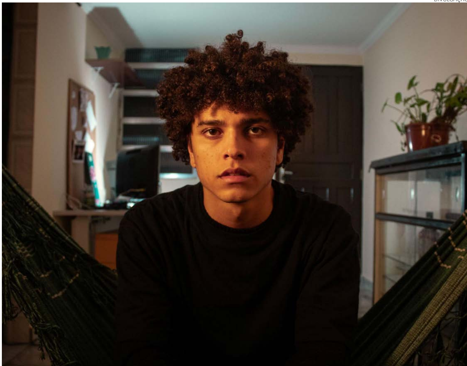
Cena do filme “Disforia”: obra integra programação do festival GO Film, neste fim de semana, no Shopping Cidade Jardim

Nesse grupo, inclui-se também “Um Romance Qualquer” (RJ), “Da Ponte Pra Cá” (SP), “Leo” (Espanha), “Vida De Ci-