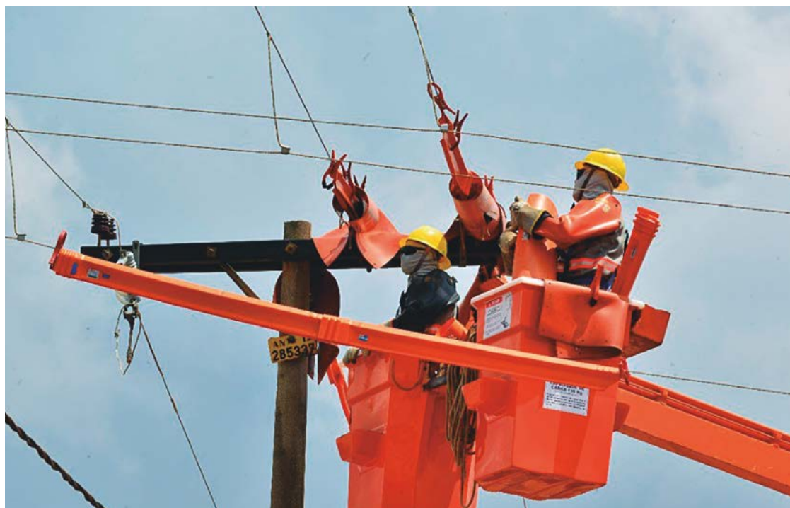
Além das quedas de energia, houve cobrança do acúmulo de fios nos postes e pela reabertura do CD na cidade