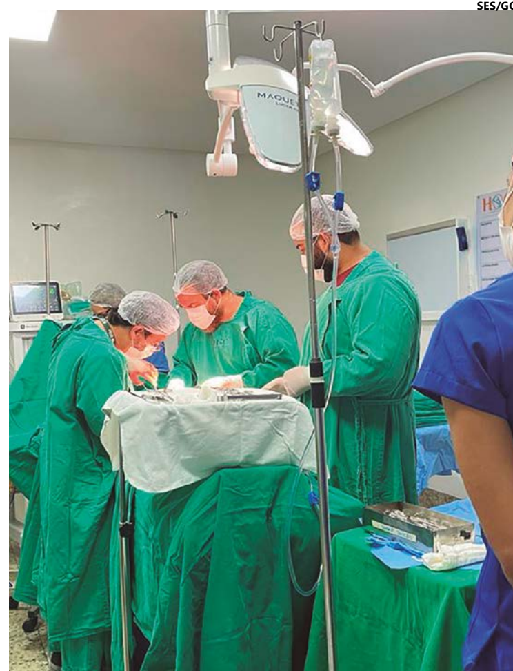
Número de doadores cresceu 39,5% no ano passado, dentro de uma proporção que supera o recorde histórico que foi registrado em 2018