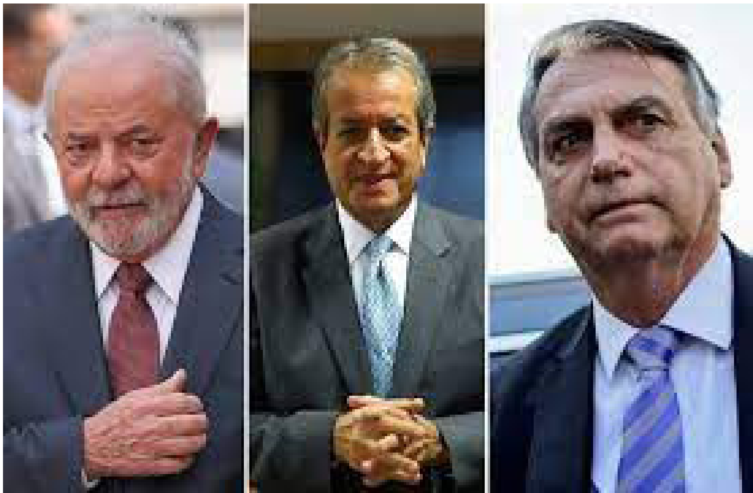
Lula da Silva, Valdemar Costa e Jair Bolsonaro: polêmica e divergência

O trecho foi mal recebido por setores no PL ligados ao ex-presidente. Jair Bolsonaro ficou indignado com os elogios