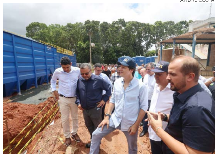
Vice-governador Daniel Vilela vistoria obras da nova estação de tratamento de água

Durante a agenda em Caldas Novas, o vice-governador ainda destacou os investimentos que o Governo do Estado tem feito na infraestrutura viária - caso da duplicação da rodovia GO-213, até Morrinhos, e da GO-139, até Piracanjuba.