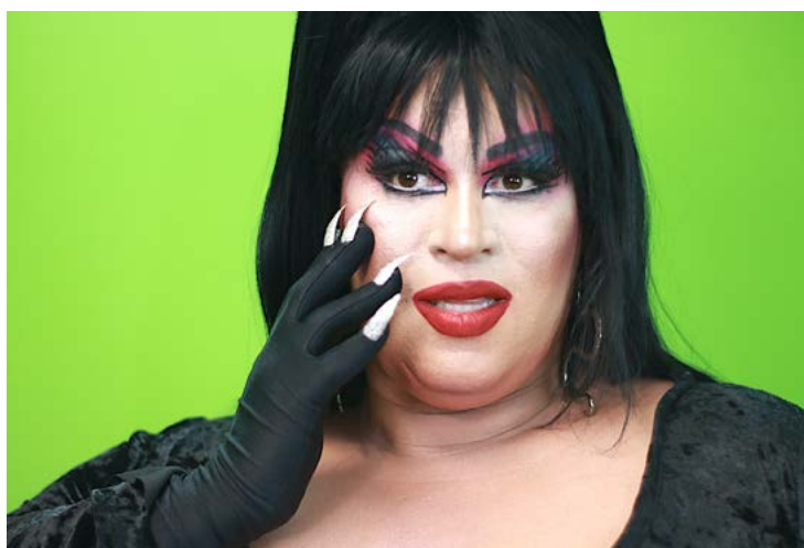
Representatividade: filme problematiza caracterização estereotipada da população trans